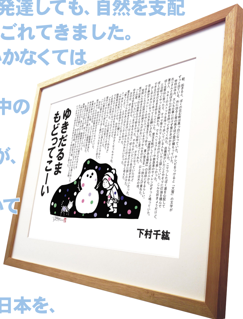
2018年ざぶん大賞のアート作品。 装画は、切り絵作家 百鬼丸氏。

水は生命の源です。 人は自然と共に生きてきました。 地球からたくさんのエネルギーをもらいました。 しかし、どれだけ科学が発達しても、自然を支配 できません。海も空もよごれてきました。 地球はみんなで守っていかなくては なりません。 2050年までには、世界中の 魚の重さより、海の中の プラスチックごみの方が、 多くなるそうです。 自然や命の大切さについて 考えましょう。 体験したことや、想いを ぜひ書いて下さい。 みなさんが、これからの日本を、 さらに世界を築いていく主役なのです。